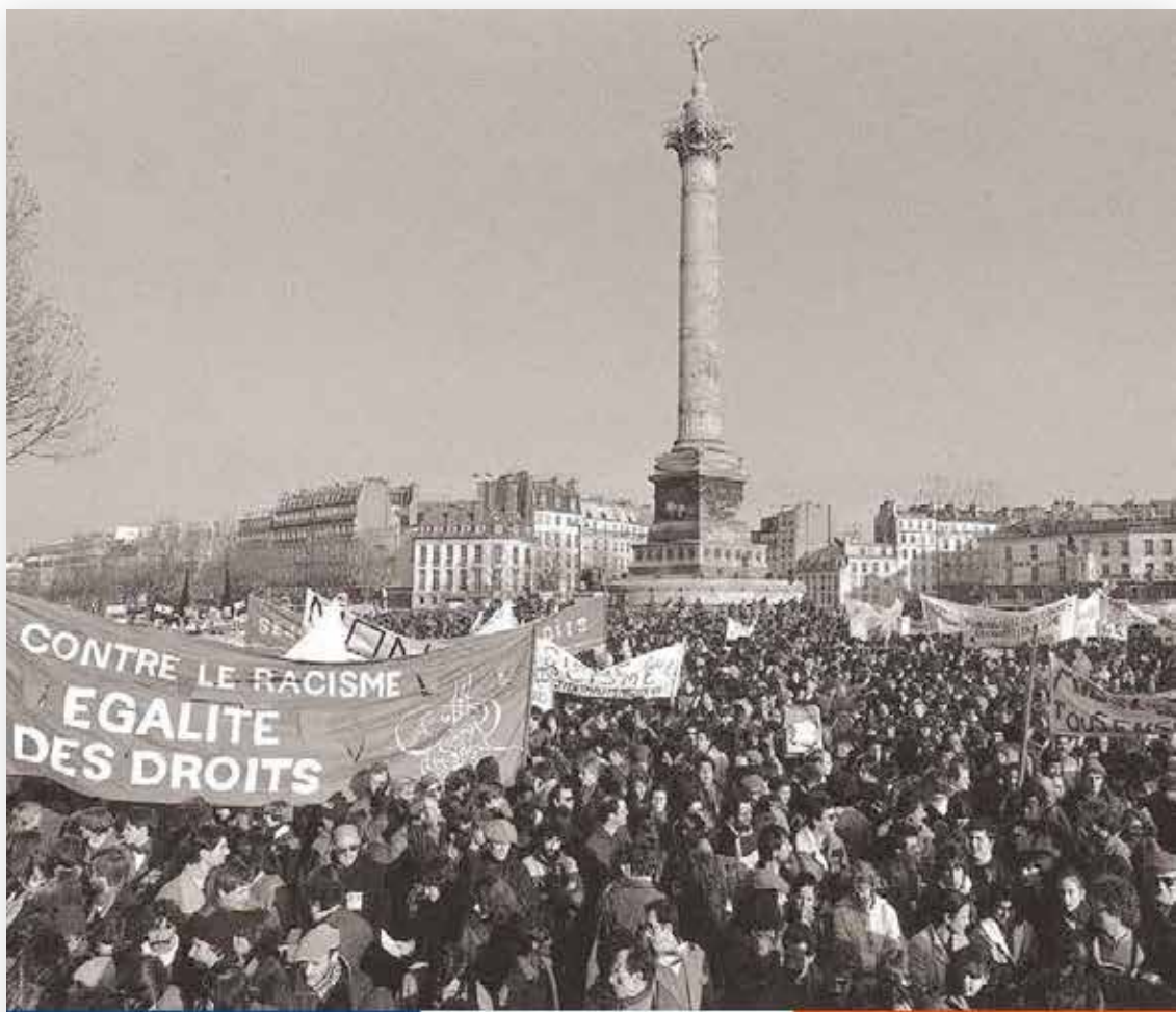
Photo de l'Agence de presse France Presse, photographiée par AFP - 2011